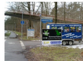
Abzweig am Adenauerring in die Linkenheimer Allee