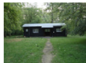
Treffpunkt auf dem Gelände